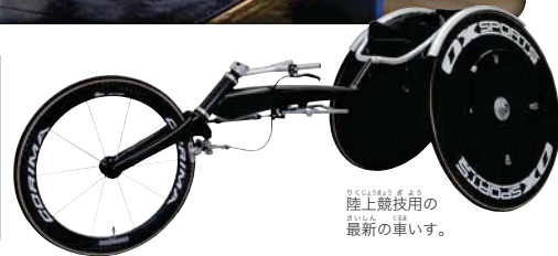
陸上競技用の最新車いす。